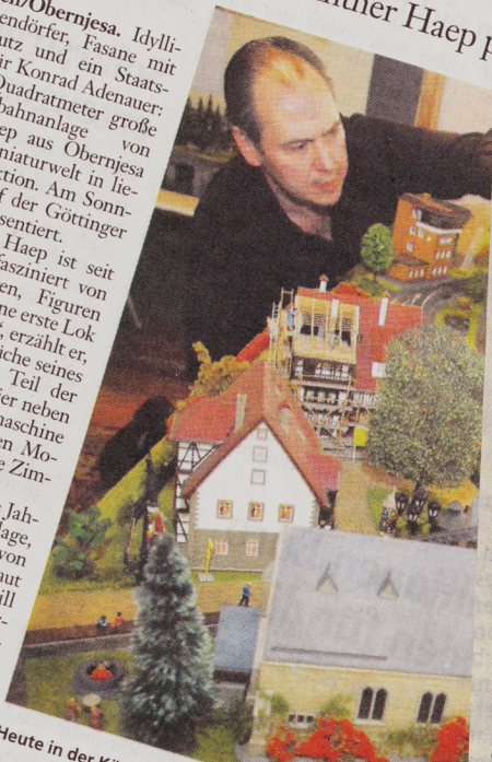
Heute in der Küche, Sonntag auf der Göttinger Modell

Die Modellbörse und die dazugehörige Ausstellung „Heile Welt auf Rädern“ findet am Sonntag, 20. Dezember, von 10 bis 16 Uhr im Schützenhaus am Göttinger Schützenplatz statt.