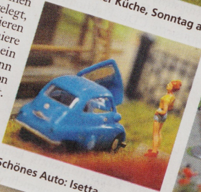
Schönes Auto: Isetta.