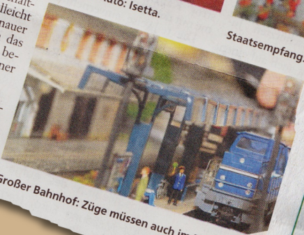
Großer Bahnhof: Züge müssen auch im A